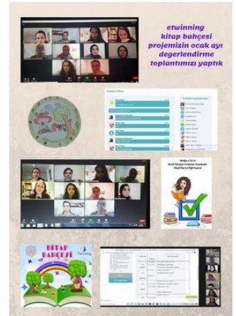
ocak ayı toplantımız