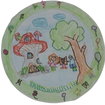
kitap bahçesi logomuz

http://rmeao.meb.k12.tr/icerikler/okulumuzda-kitap-bahcesiprojesi-uygulanmaya-baslamistir_10692844.html