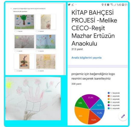
sınıf bazında logo seçim anketi