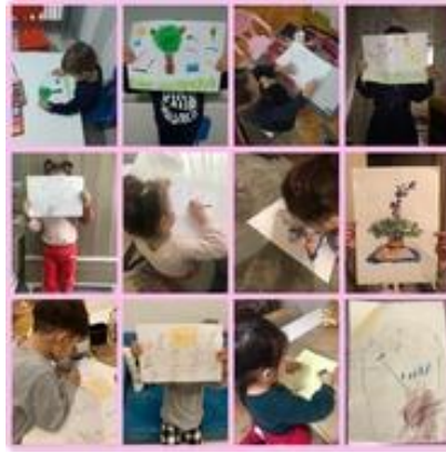
logo çalışması çizim