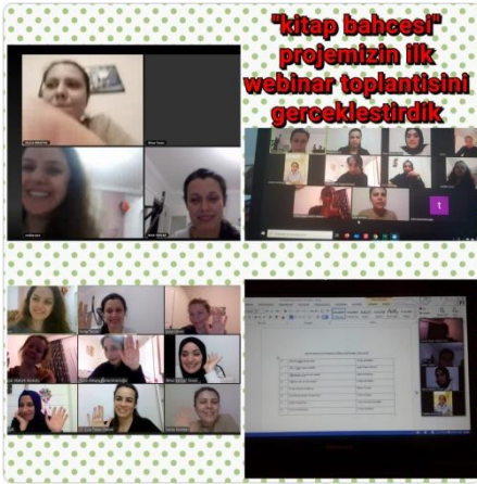
Proje tanışma toplantımız