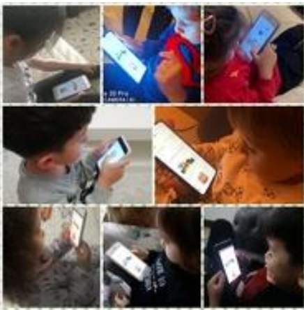
Öğrenci ön anketi